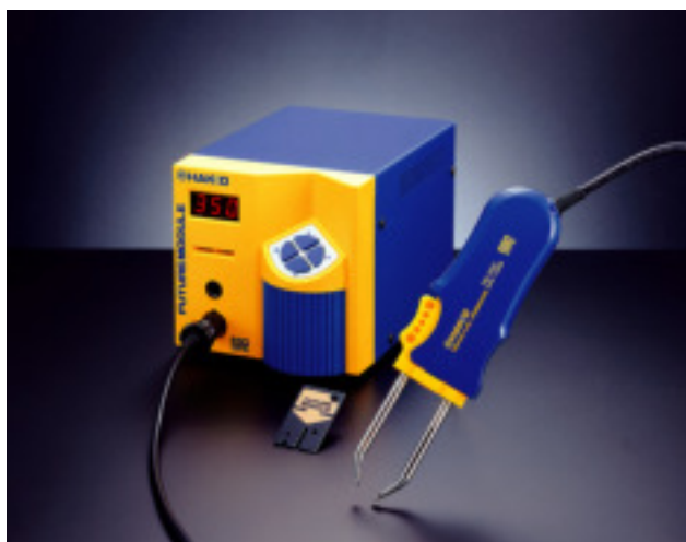
MODEL FM-202 mit MODEL FM-2022

Trotz der hohen Leistung wiegt die Pinzette nur handliche 53g und die Lötspitzen ca. 11g